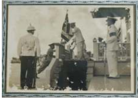
พระบาทสมเด็จพระปรมินทรมหาภูมิพลอดุลยเดช พระราชทานธงชัยเฉลิมพล เมื่อวันที่ ๑๓ ตุลาคม พ.ศ. ๒๔๙๗

พุทธศักราช ๒๕๐๓ ได้มีพระราชกฤษฎีกาแบ่งส่วนราชการกรมตำรวจ กระทรวงมหาดไทยใหม่ โดยตั้งกองบัญชาการศึกษาขึ้นและโอนการปกครองบังคับบัญชาโรงเรียนพลตำรวจภูธรทุกแห่ง รวมทั้งโรงเรียนพลตำรวจภูธร ๙ ซึ่งเดิมขึ้นอยู่กับกองบังคับการตำรวจภูธรภาค ๙ ให้ไปขึ้นอยู่ในสังกัดกองบัญชาการศึกษาและตั้งชื่อโรงเรียนใหม่นี้ว่า “โรงเรียนตำรวจภูธร ๔” แต่โรงเรียนยังตั้งอยู่ที่เดิม