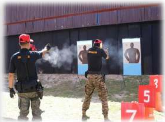
- สนามทดสอบกำลังใจ จำนวน ๑ แห่ง